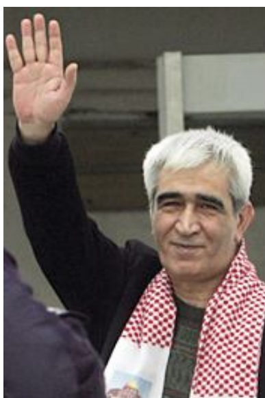
Ahmed Saadat, segretario generale del Fronte Popolare per la Liberazione della Palestina, imprigionato illegalmente dal sionismo

I Cinque eroi cubani - Gerardo Hernández, Ramón Labañino, Fernando González, Antonio Guerrero e René González - condannati e rinchiusi da 14 anni nelle carceri statunitensi per aver difeso Cuba dalle azioni di gruppi terroristici