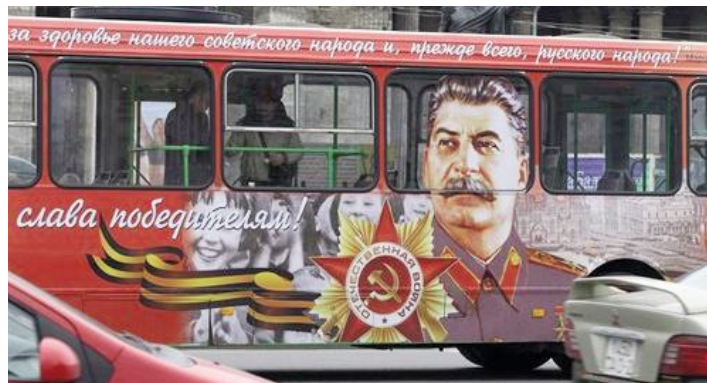
Autobus decorati in 40 città dell'ex Unione Sovietica

Questi partiti – che affondano in una crisi sempre più grave e subiscono processi di distacco e differenziazione alla loro base - non possono offrire una via di uscita ai problemi che