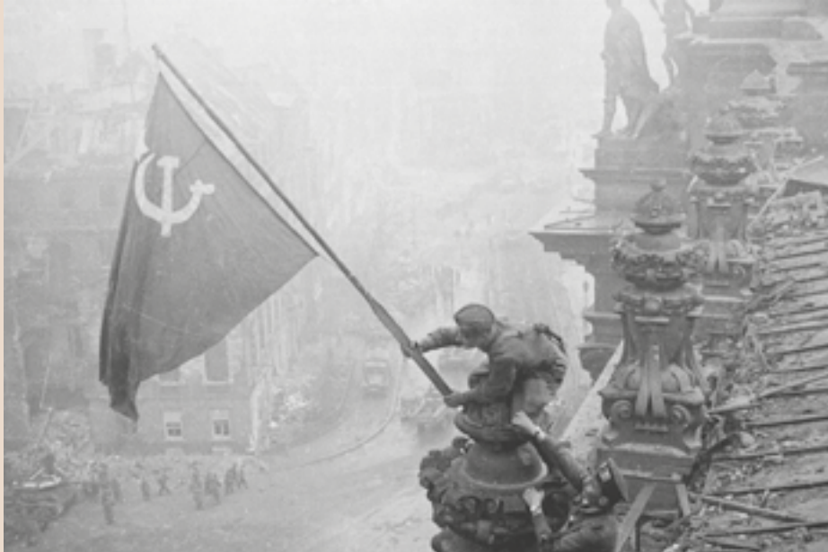
Fotografía de Yevgeni Jaldéi que muestra a soldados rusos haciendo flamear una bandera soviética en los techos del edificio del Reichstag, el 30 de abril de 1945.

Hoy las fuerzas burguesas y imperialistas que gobiernan Rusia con Putín a la cabeza, pretenden seguir aprovechándose de esa heroica gesta, que es obra del socialismo, del marxismo leninismo, de la dictadura del proletariado, del gran Stalin.