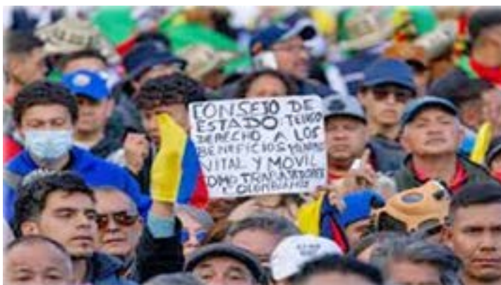
Los trabajadores colombianos se toman las calles exigiendo respeto a sus derechos constitucionales, en especial al reconocimiento de un salario mínimo vital y móvil que posibilite una vida digna.

y la política del mundo marcada por el desespero yanqui ante sus claras señales de decadencia general, que ya registran en las calles los ocho millones de manifestantes que gritaron “NO KING” el sábado 28 de marzo, señalan como perspectiva una fuerte profundización de la crisis económica, social y política del país que empiezan a tener manifestaciones en las convocatorias huelguísticas del magisterio, los municipios de pequeños medianos mineros, comunidades afro, trabajadores de servicios públicos domiciliarios y sectores de la juventud, hechos sociales y políticos que por fuera de los resultados electorales marcan las grandes discusiones sobre las políticas y la gestión desarrollada por el gobierno colombiano para enfrentar además de entorno cambiante y de reconfiguración a nivel internacional, la difícil situación de desigualdad y exclusión social, económica y política que padece Colombia.